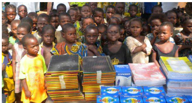
Distribution de fournitures scolaires