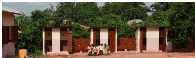
Construction d'urinoirs et de lavabos, adduction d'eau potable. Ici à l'école maternelle d'Adjohoun