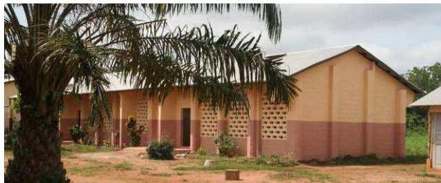
Construction et rénovation de bâtiments Ici à l'école primaire de Gbékandii II